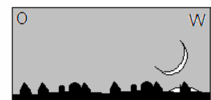
Fig. 3 Vóór zonsondergang

Een tweede Baraita over de hoogte van de maan t.o.v. de horizon: WANNEER ÉÉN GETUIGE ZEGT DAT DE NIEUWE MAAN TWEE PRIKKELS 1 BOVEN DE HORIZON STOND EN DE ANDER ZEGT DRIE PRIKKELS, DAN WORDEN ZE GELOOFD [want het verschil is klein en te verwaarlozen, want men kan zich makkelijk daarin vergissen]. MAAR ALS DE ÉÉN ZEGT DRIE PRIKKELS EN DE ANDER ZEGT VIJF PRIKKELS, DAN WORDEN ZE NIET GELOOFD [want het verschil is te groot om toe te schrijven aan een vergissing], MAAR ZE KUNNEN WEL GECOMBINEERD WORDEN MET EEN ANDERE GETUIGE. [D.w.z. wanneer de derde getuige overeenkomt met een van de twee eerste getuigenissen, dan is hun getuigenis geldig en het Beit Din kan de nieuwe maan dan inwijden ( Rasji ).]